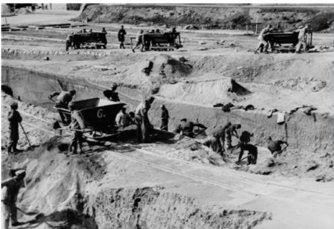
Trabalhos forçados no campo de concentração de Mauthausen, na Áustria.