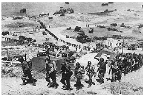
Desembarque na Normandia – Bansa Consultoria Editorial Ltda.

No processo histórico da Segunda Guerra Mundial o dia 6 de junho de 1944 é conhecido como o Dia D. Por que o Dia D foi tão importante?