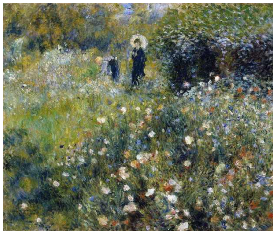
Mulher com sombrinha no jardim (1875), de Renoir, é uma obra impressionista