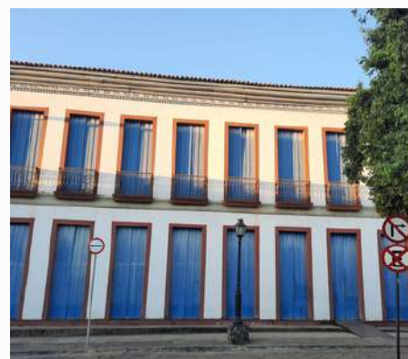
Museu Regional do Norte de Minas

Fundado em 22 de maio 1979, o prédio abriga a galeria de artes Godofredo Guedes; o a sala Cândido Canela; a Biblioteca Pública Municipal Antônio Teixeira de Carvalh. O prédio também é sede da Academia Montesclarensense de Letras e da secretaria municipal de Cultura.