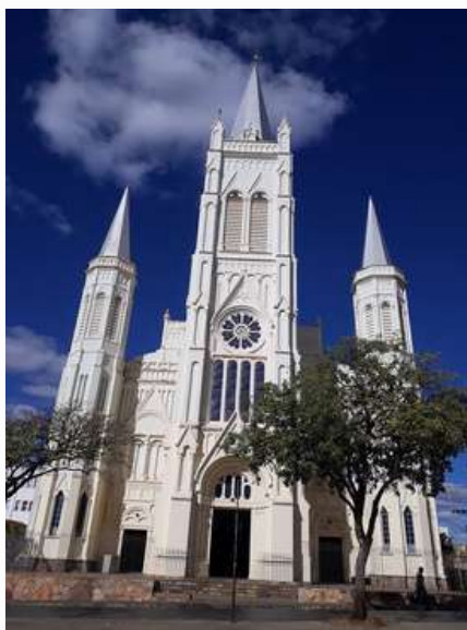
Catedral de Nossa Senhora Aparecida

Apesar de ter passado por muitas reformas, a igreja, situada na Praça Dr. Chaves, representa a origem histórica de Montes Claros, quando ainda Arraial de Formigas.