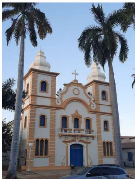
Igreja Matriz de Nossa Senhora da Conceição e São José

Verifiquem suas passagens! Confiram suas bagagens e se acomodem para uma jornada histórica pela cidade de Montes Claros, a nossa Princesinha do Norte.