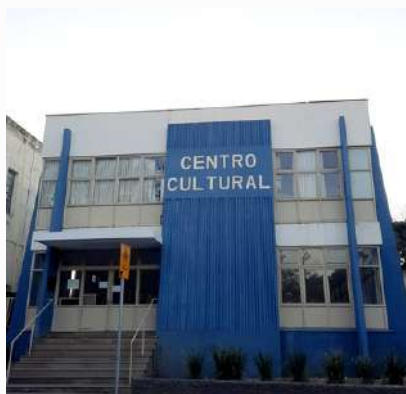
Centro de Educação e Cultura Dr. Hermes de Paula

As Festas de Agosto de Montes Claros, tradicionalmente conhecidas em todo o Norte de Minas, tem devoções católicas realizadas na Igreja Nossa Senhora do Rosário, que antes era uma capela, desde os primeiros anos de realização.