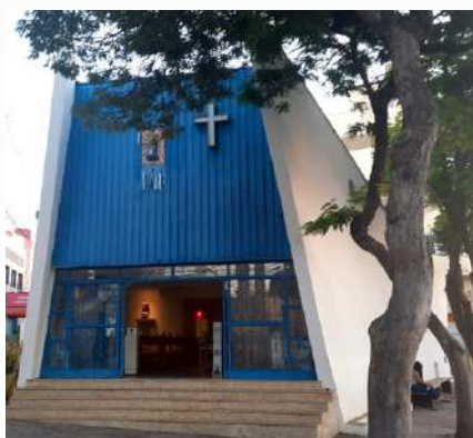
Igreja Nossa Senhora do Rosário

No local onde está hoje o Santuário, existia no passado uma capela. Devido ao crescimento populacional, o novo templo foi construído para acolher maior número de fiéis.